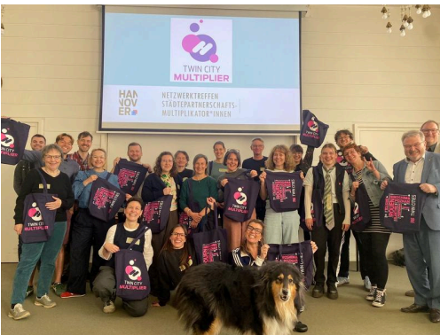
Multiplikator*innen Urheber: Kulturbüro

Es waren noch einige Kirschblüten an den Bäumen als das Kirschblütenfest am letzten Sonntag im April bei strahlendem Sonnenschein im Hiroshima-Gedenkhain stattfand. Viele Besucher*innen erfreuten sich an den unterschiedlichen Angeboten der Vereine und Initiativen, schauten bei den Kampfkunstvorführungen zu oder picknickten auf der Wiese unter den Bäumen. Die Taiko Trommelgruppe Akaishi Daiko aus Magdeburg waren in diesem Jahr mit dabei. Aber ohne all die ehrenamtlich tätigen Vereine könnte das Fest nicht so schön bunt und abwechslungsreich stattfinden.