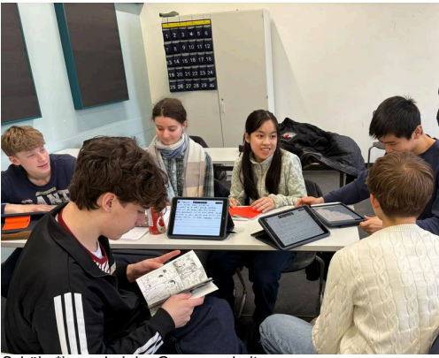
Schüler*innen bei der Gruppenarbeit Urheber: Anna Sanner