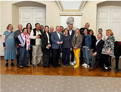
DPG Hannover in Poznan