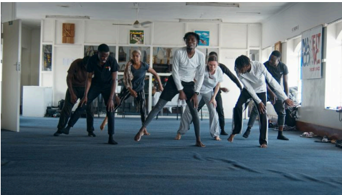
Gemeinsame Probe