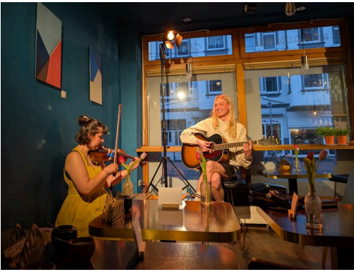
Konzert in Linden backt!