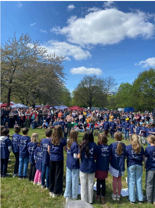
Südstadtschulchor beim Kirschblütenfest Urheber: Kulturbüro