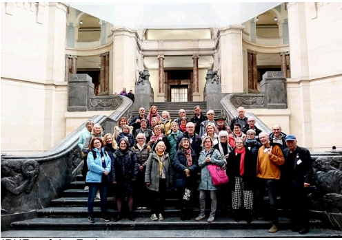
IBHR auf der Rathaustrampe