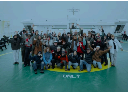
Mitglieder des Fotobus e.V in Bristol